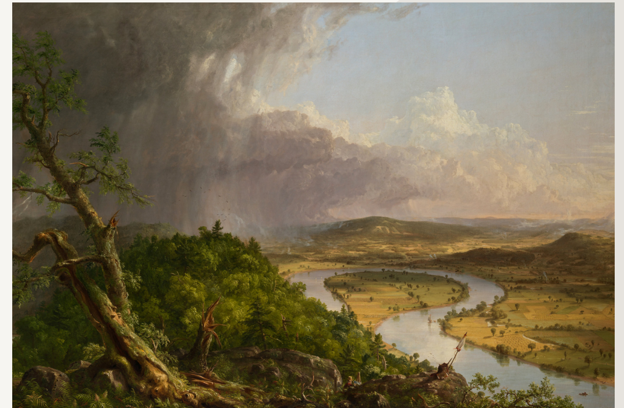
The Oxbow (1835-1836) Thomas Cole Óleo sobre lienzo 130.8 cm. x 193 cm.