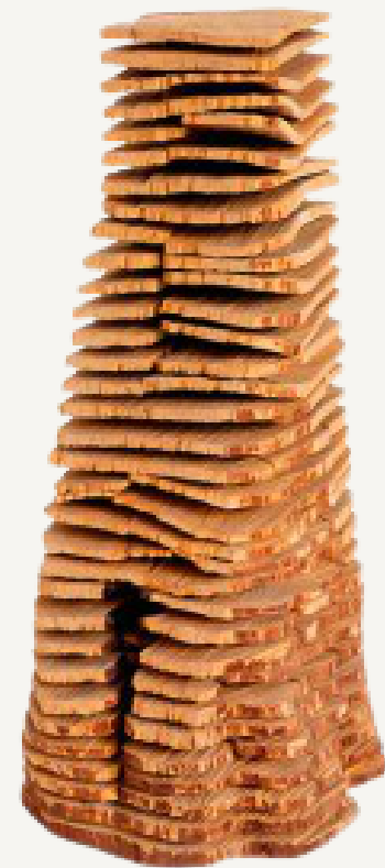
Birch crack and warp column (1999) David Nash Escultura objeto 45.4 X 23 X 18 cm