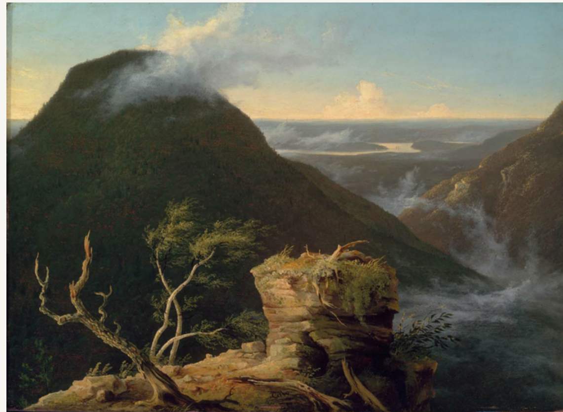
View of the Round-Top in the Catskill Mountains (1827) Thomas Cole Óleo sobre tabla 47.31 x 64.45 cm