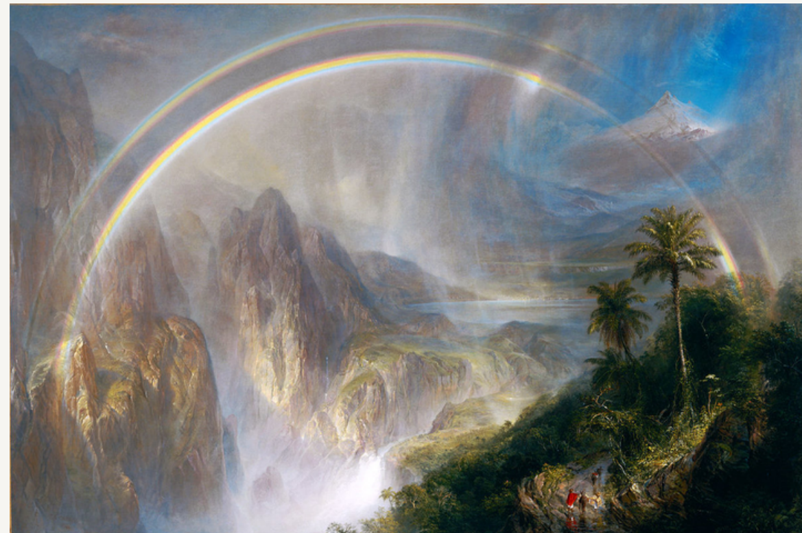
Rainy Season in The Tropics (1886) Frederic Edwin Church Pintura al óleo 56.25 x 84.25 in