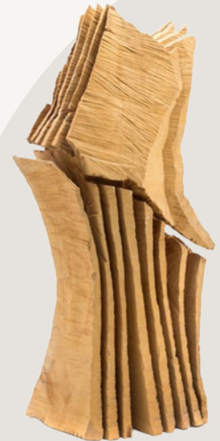
Ripcut Two Sack 1998 David Nash pear wood 48.26 x 17.78 x 17.78 cm