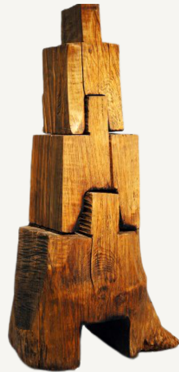
Tongue and groove stove, 1983 David Nash Escultura objeto 100 X 60 X 40 cm