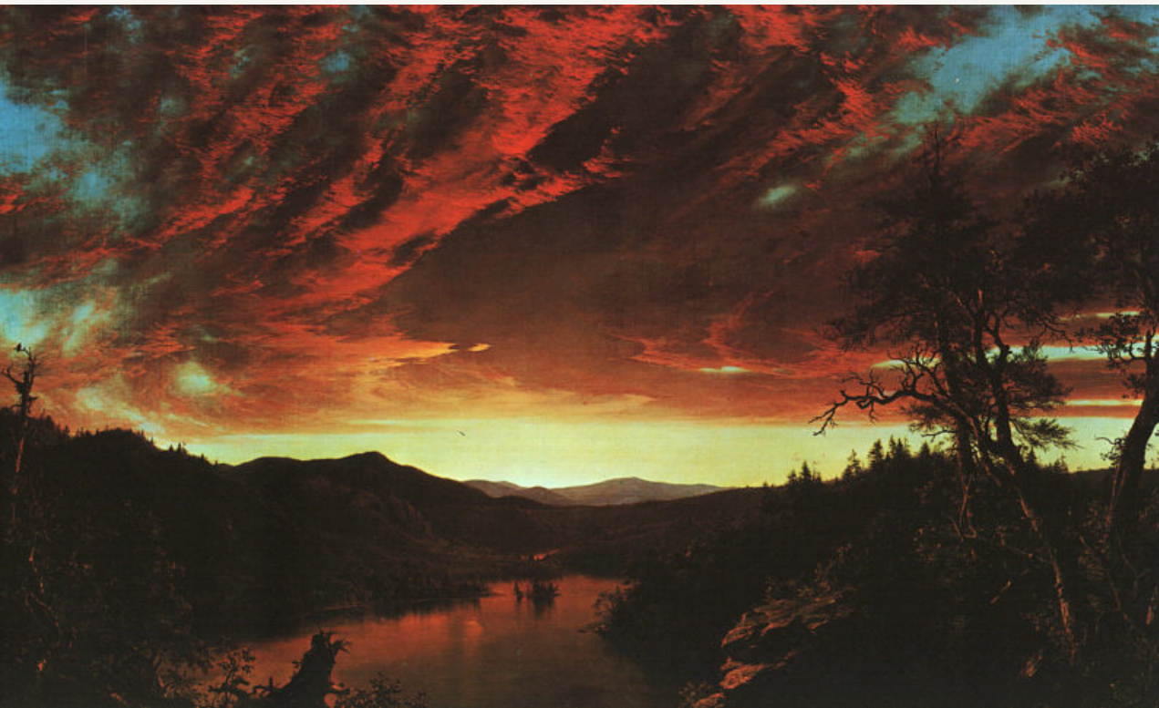
Twilight in the Wilderness (1860) Frederic Edwin Church Óleo sobre lienzo 101,6 x 162,6 cm