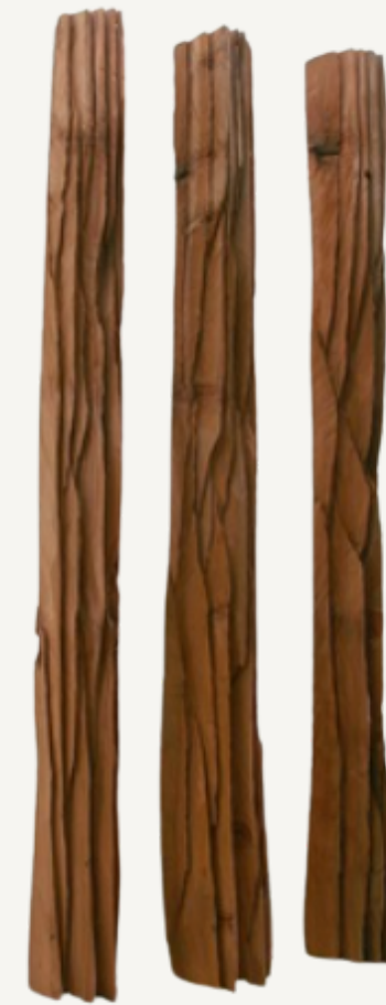
Three Red Columns: Deepcut, 2010 David Nash Sculpture, Redwood 303 x 28 x 26 cm