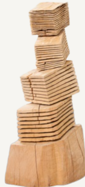
Tumble Blocks, 2002 David Nash Sculpture, beech 180 x 68 x 76 cm