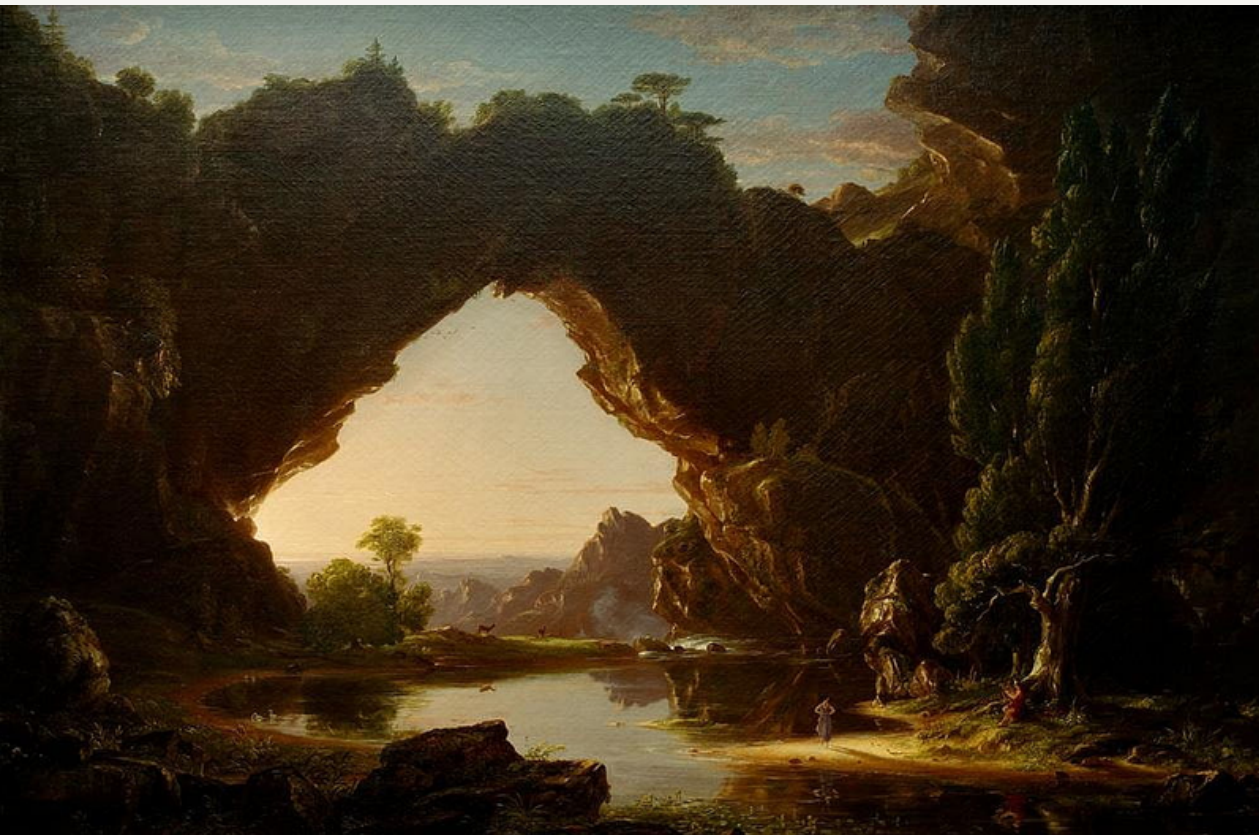
Tarde en Arcady (1843) Thomas Cole Óleo sobre lienzo 129.5 x 193 cm