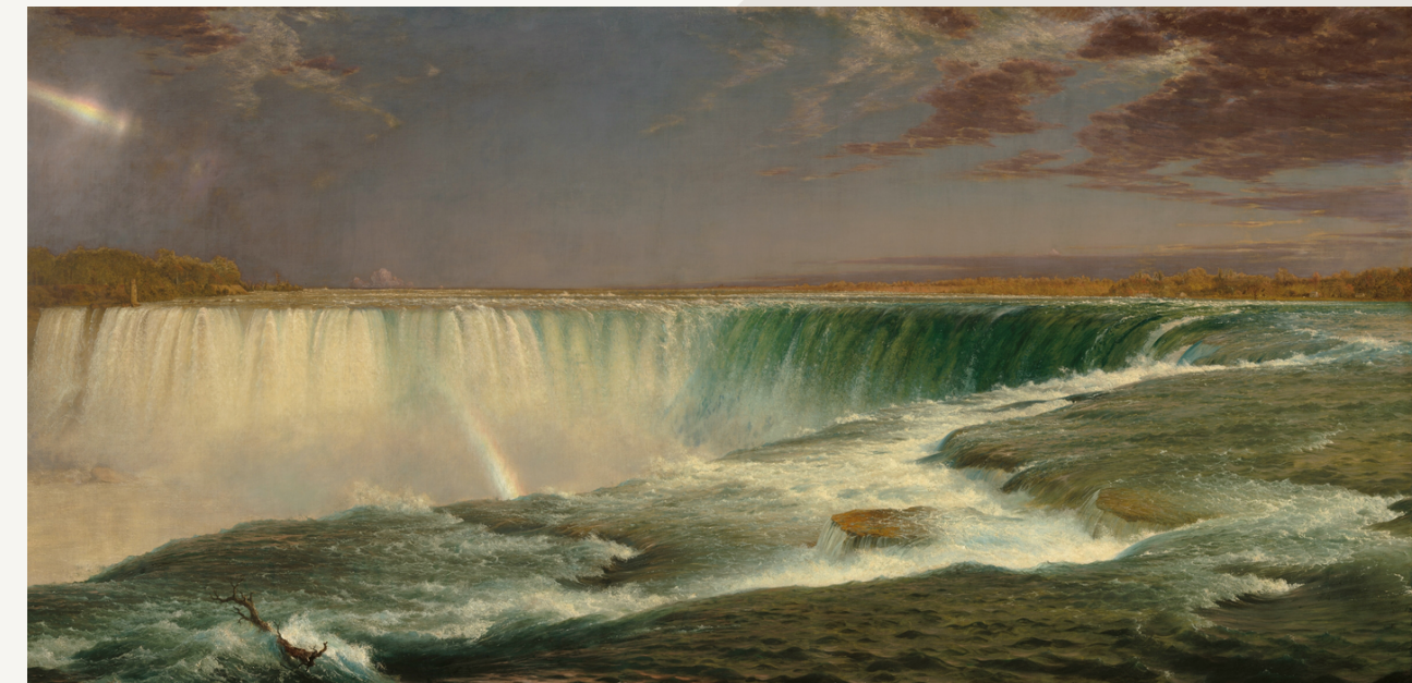
Niagara (1857) Frederic Edwin Church Pintura al óleo 101,6 cm. × 229,9 cm